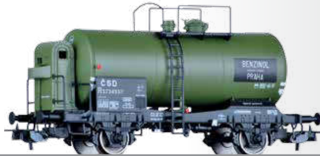
Kesselwagen R „BENZINOL“ der ČSD Tank car R „BENZINOL“ of the ČSD