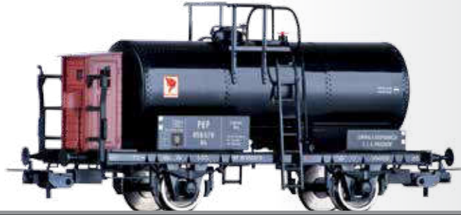
Kesselwagen Rh der PKP Tank car Rh of the PKP