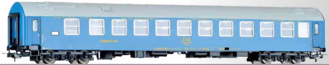
Schlafwagen WLAB, Typ Y, der ČSD Sleeping coach WLAB, type Y, of the ČSD